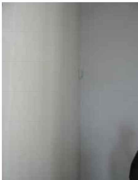
Rörelsedetektor i kyrkorummets sydöstra hörn