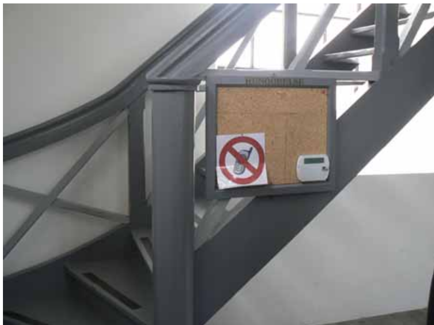
Inbrottslarmets manövertablå placerad på anslagstavlan i vapenhuset

Brandlarmsystemet har analoga adresserbara detektorer. Detektorerna är rökdetektorer, värmedetektorer, samt ett aspirerande system till kyrksalen som är förlagt till vinden, där befintliga håltagningar för ljuskronorna kunde utnyttjas. Systemet är anslutet till SOS/Räddningstjänsten för direkt utryckning av brandkåren.