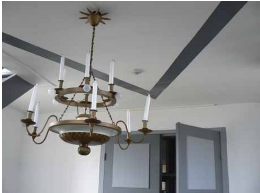
Branddetektor i vapenhuset