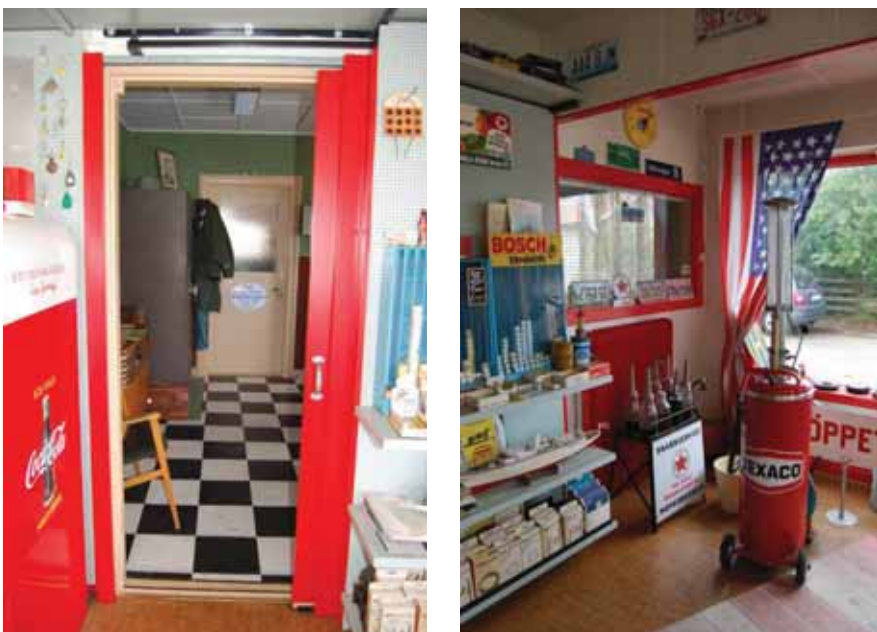
Bilden till vänster: Dörren in till kontoret. Bilden till höger: Fönstret in i till kontoret från vilket stationsföreståndaren hade översikt över de kunder som kom in.