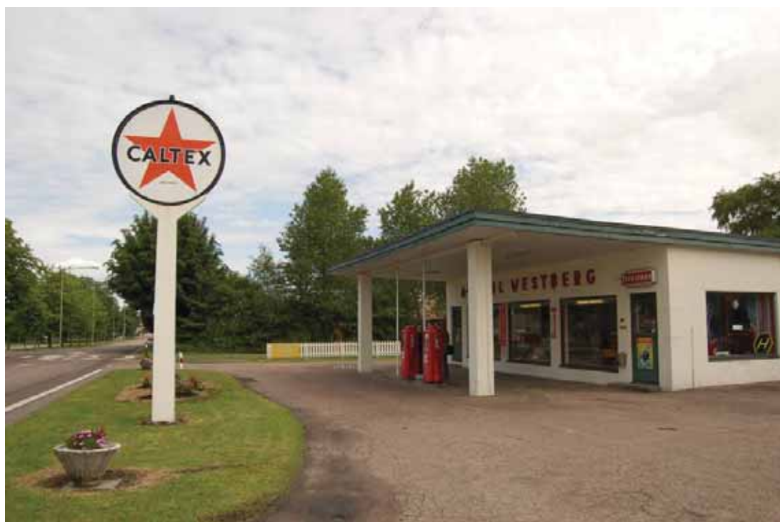
Bensinstationen mot norr.