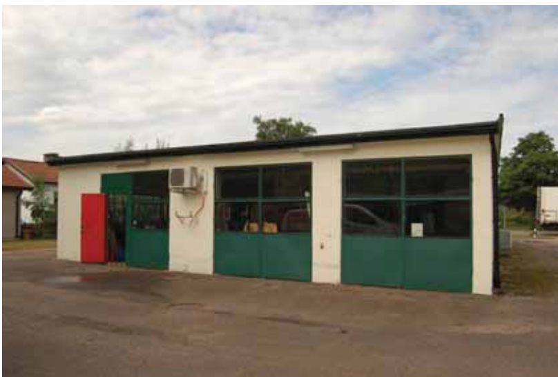
Bensinstationen med det förlängda partiet i öster med in- och utfart till verkstaden.