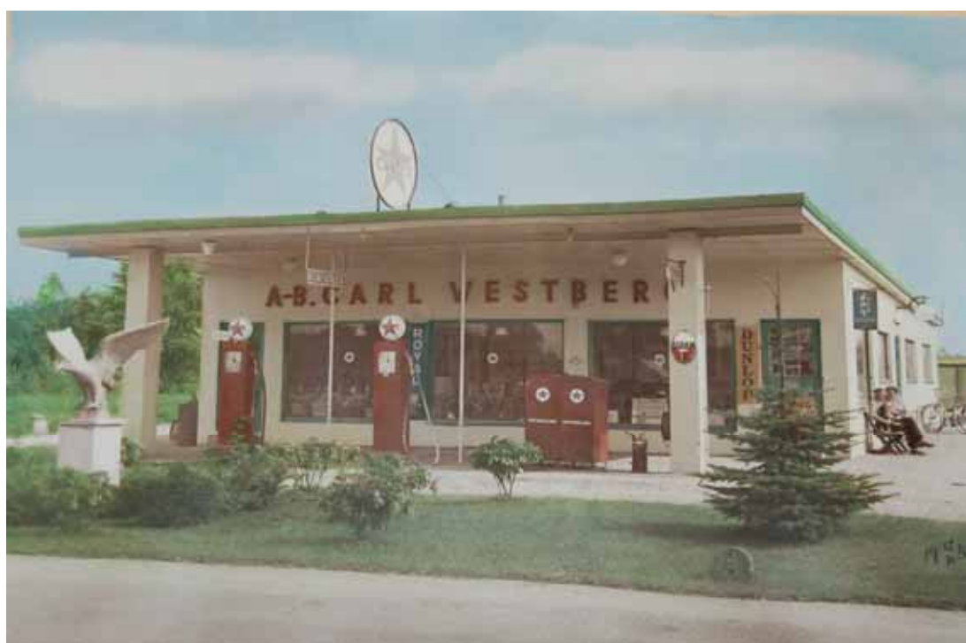
Bensinstationen som den såg ut 1951.