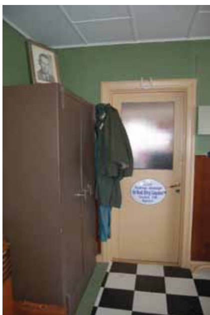
Kontoret mot öster med dörren in till verkstaden.