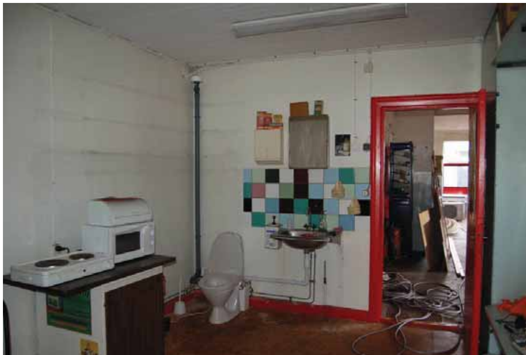
Personalrummet mot öster med dörren in mot verkstaden.

I detta rum finns förhållandevis ny köksutrustning och toalett. Rummet fungerar som personalrum och har kanske varit det också från början, eventuellt med köksinredning men utan toalett. Det ursprungliga golvet kan ha varit ett linoleumgolv likt det i kontoret. Väggarna är ommålade liksom snickerier. Den ursprungliga färgsättningen är osäker. Taket är ett sannolikt ursprungligt innertak av träpanel.