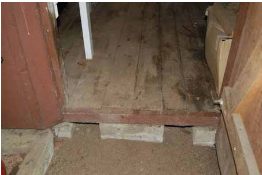
Mellanvägg med en dörr mellan två rum som skvallrar om att byggnaden helt eller delvis är äldre än vad den ser ut utifrån.