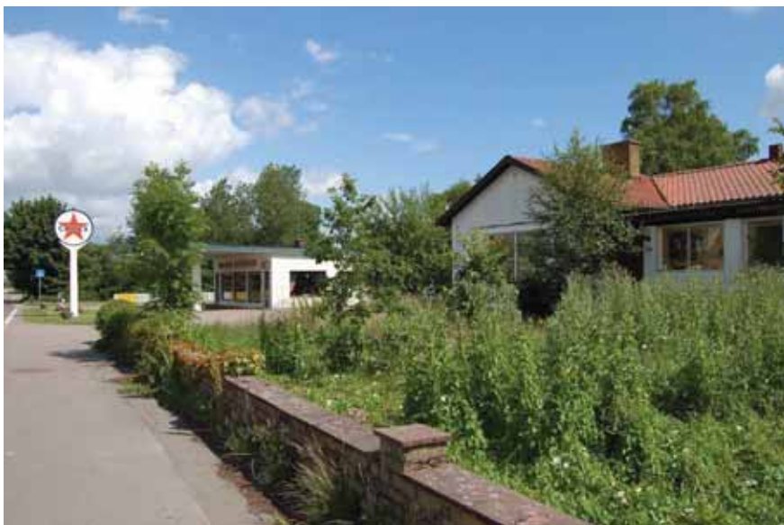
Bensinstationen 2013 med stationsföreståndarens villa.