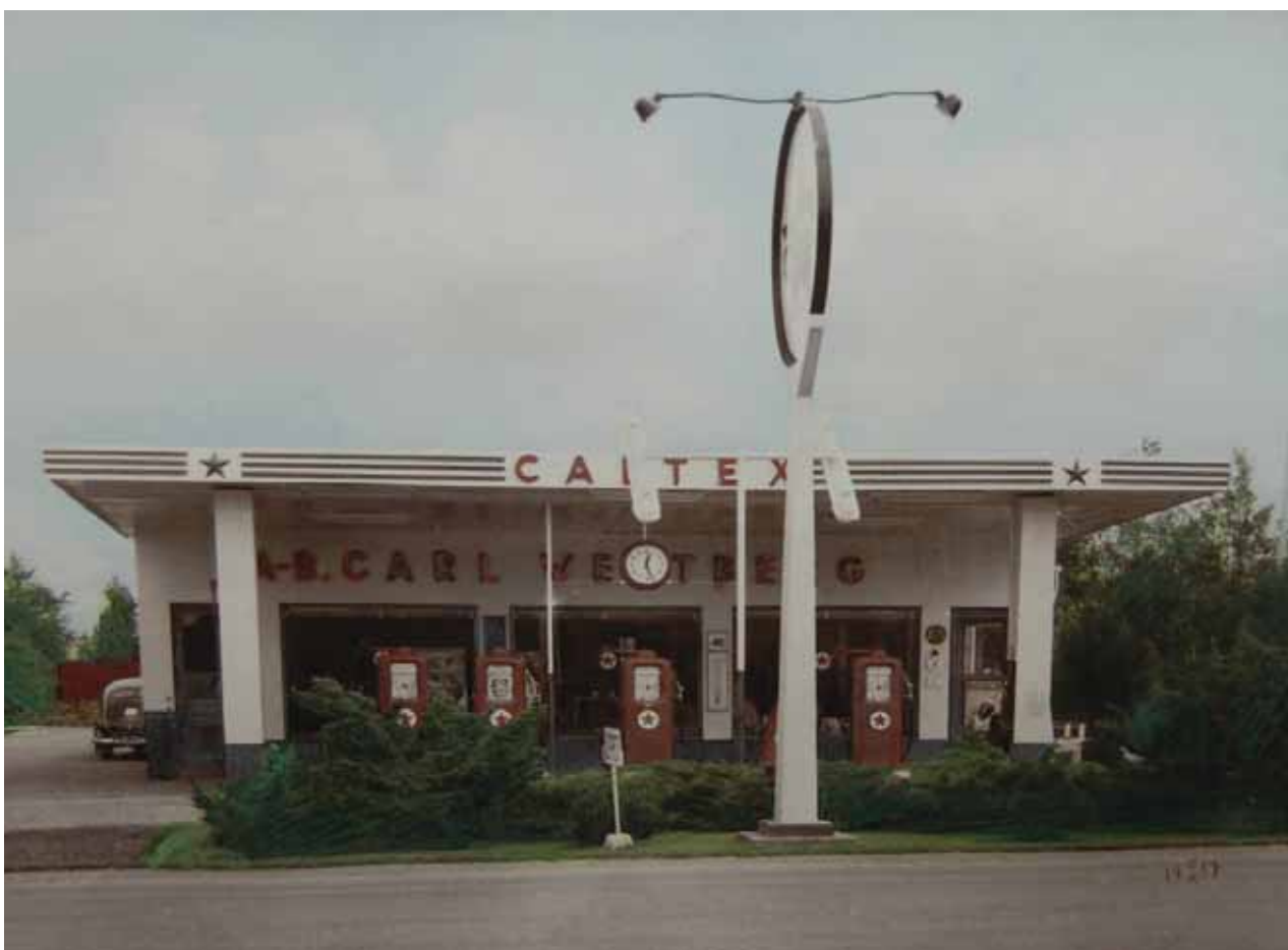
Bensinstationen som den såg ut 1957 med sin putsade ljusa fasad, en grön sockelmålning och för bolaget typiska mörkgröna randning (ofta tre linjer) vid taklinjen. Den klocka som hänger centralt på denna bild fanns inte på bensinstationen 1948 och 1951. Den finns inte heller kvar idag.