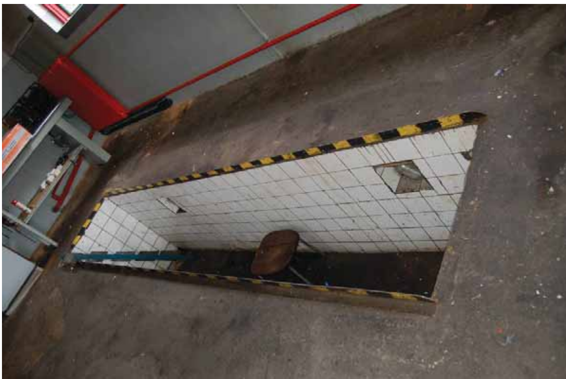
Den norra verkstadsdelen. Smörjgropen.