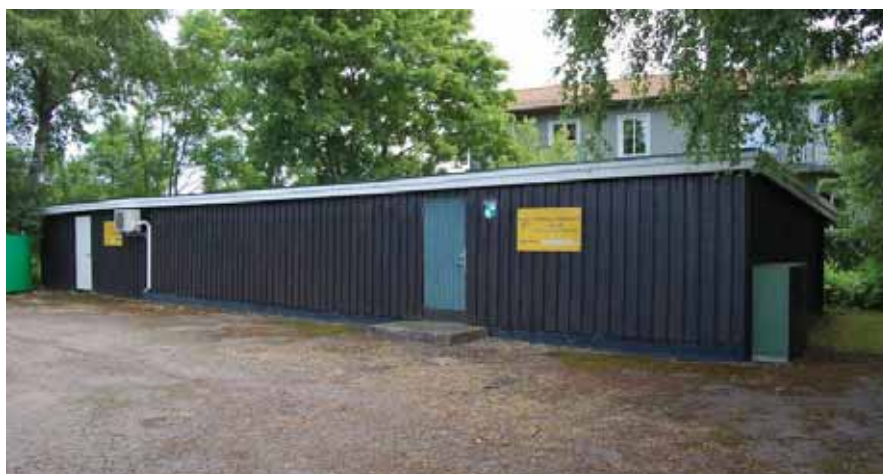
Uthuset mot väster.

På bilden från 1951 anas ett uthus bakom bensinstationen. Uthuset putsat och avfärgat i en gul kulör samt har gröna portar. Det är osäkert om det rör sig om samma uthus som det som står på platsen idag eftersom byggnaden på bilden saknar sockel.