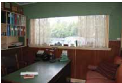
Kontoret mot söder med bevarat möblemang.