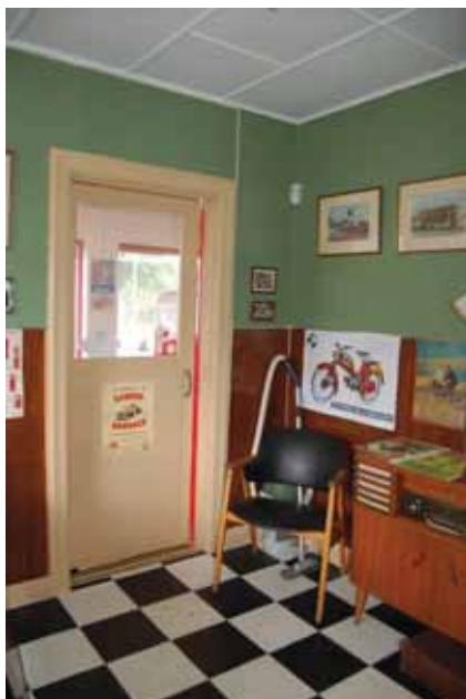
Kontoret mot nordväst med dörren in till butiken.