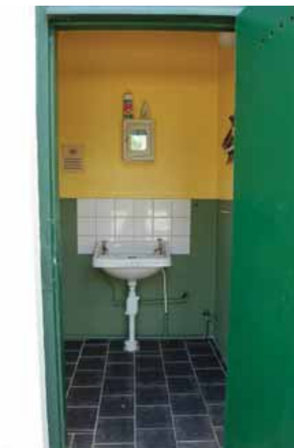
Bensinstationens WC mot norr.