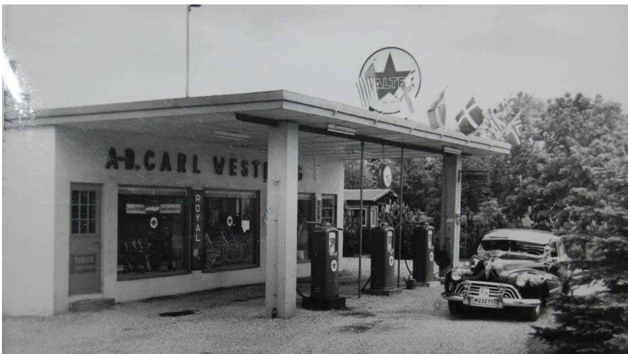
Bensinstationen som den såg ut någon gång mellan 1951 och 1957.