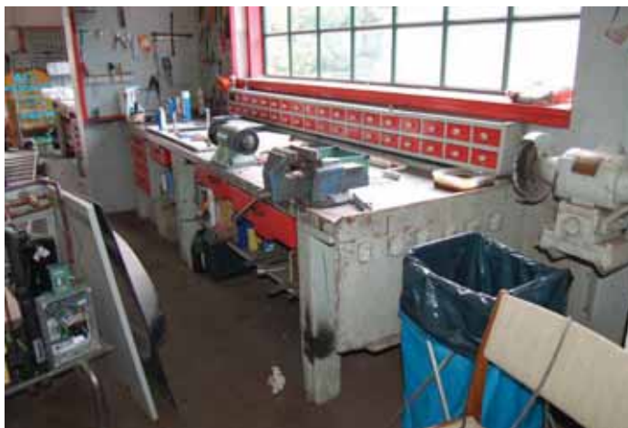
Den södra verkstadsdelen. Bänken är sannolikt ursprunglig.