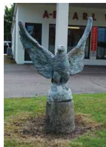
Bilden till vänster: En av urnorna. Bilden till höger: Statyn föreställande en örn.

Direkt norr om bensinstationen låg en ekonomibyggnad tillhörande en gård. Ekonomibyggnaden är nu borta. Direkt söder om stationen var det öppen mark. Här uppfördes någon gång mellan 1948 och 1969 bensinstationsföreståndarens ett bostadshus.