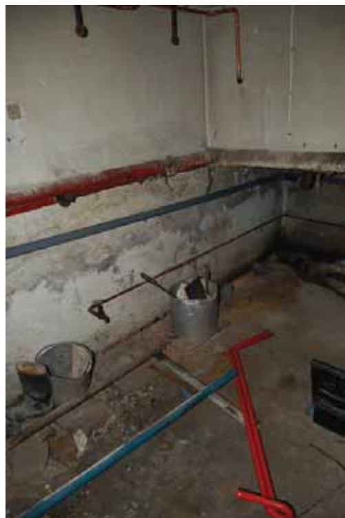
Den norra verkstadsdelen. Bilden till vänster: Nedgång till det gamla pannrummet samt förråd i väster. Bilden till höger: Pannrummet.