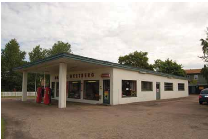
Bensinstationen mot nordost. De två dörarna under skärmtaket går in till butiken. Den högra har sannolikt fungerat som entrédörr till kontoret och en taxiverksamhet som under en period funnits där. Dörren i långsidans mitt är entrén till verkstaden.