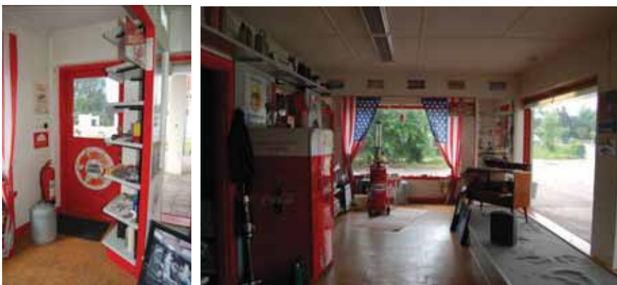
Bilden till vänster: Entrédörren till butiken. Bilden till höger: Butikslokalen mot söder.