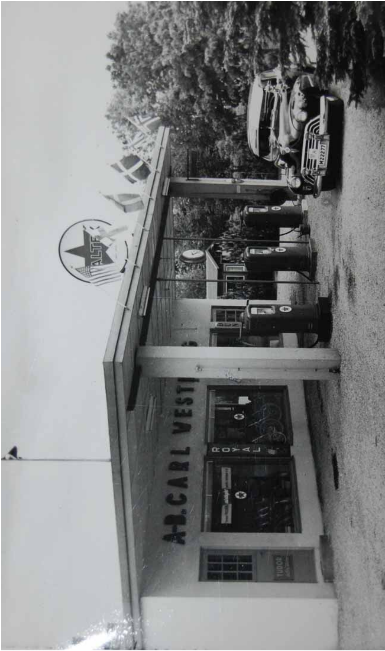
3. Mellan 1951 och 1957