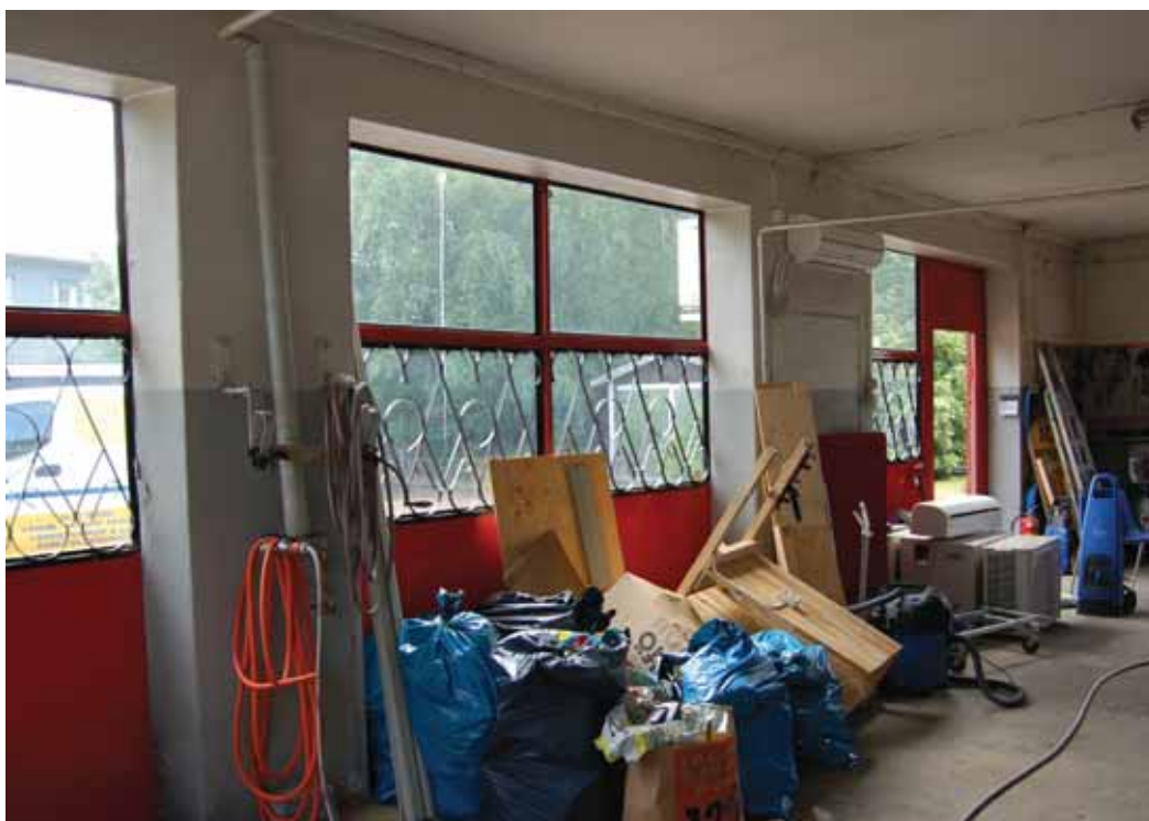
Portarna i den östra fasaden i den tillbyggda delen.