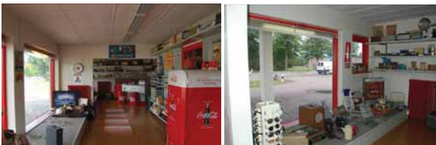
Bilden till vänster: Butikslokalen mot norr. Bilden till höger: Norra delen av butikslokalen. Dörren längst i norr är igensatt på insidan.