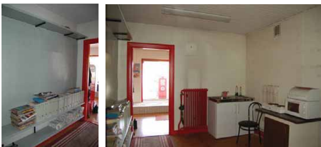
Personalrummet mot väster med dörren in till butiken.