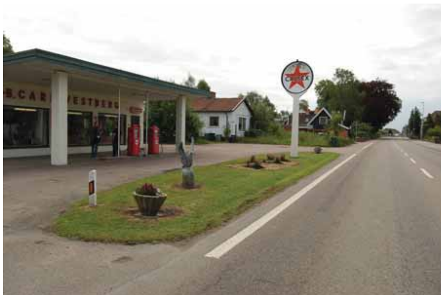
Bensinstationen, vy mot söder.