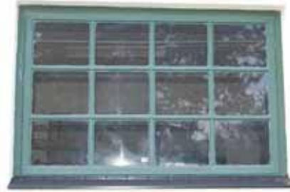
Bilden till vänster: Toalettdörren med spröjsat överljus. Bilden till höger: Ett av verkstadsfönstren.