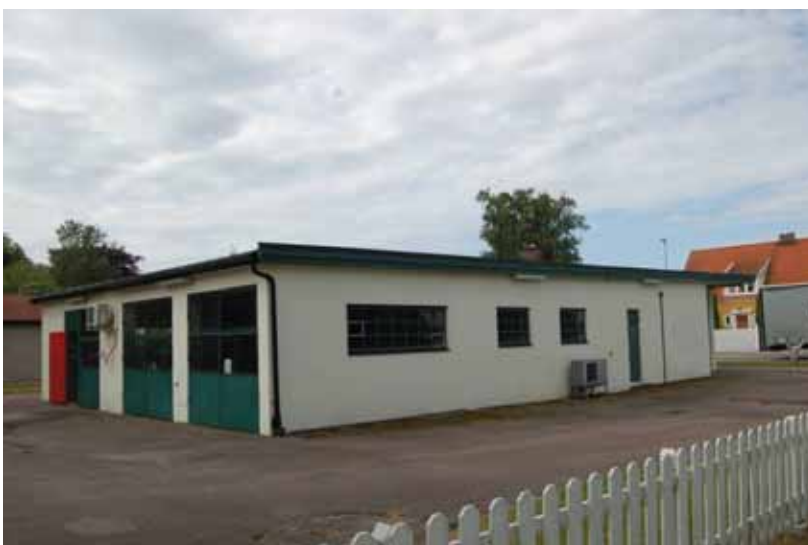
Bensinstationen mot sydväst med ingången till toaletten längst till höger.