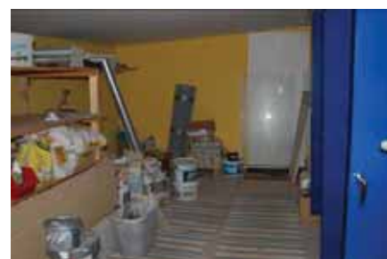
Förrådsutrymmen i byggnaden.