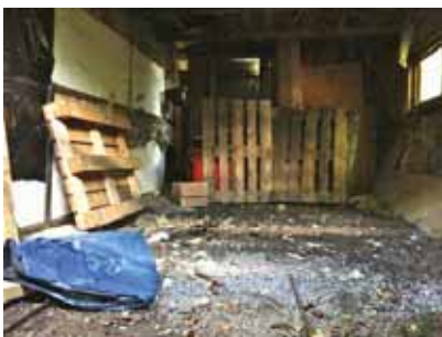
Garagets befintliga utseende ligger förmodligen nära det ursprungliga men byggnaden är i mycket dåligt tekniskt skick.