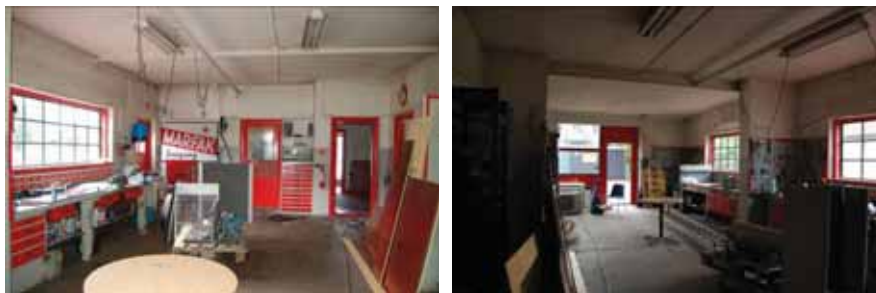
Verkstadsdelen, mot väster respektive mot öster. Mot väster ser man dörrarna in mot kontoret och personalutrymmet.

Verkstaden ligger i byggnadens östra del. Den är utbyggd mot öster och alltså större än ursprunglig verkstad. Den består av två delar, den södra med mer mekanisk inriktning med arbetsbänkar och förvaringsutrymmen. Den norra har en smörjgrop. Smörjgropen är kaklad med ett vitt kakel som bedöms vara från 1930-talet. En vägg i den äldre delen av verkstaden skiljer delvis de båda utrymmena åt. I den södra delen av verkstaden finns det i väster två dörrar, den ena till kontoret och den andra till personalrummet. Golvet består av gjuten betong som vad gäller den äldsta delen av verkstaden är från 1930-talet eftersom det finns en skarv i golvet där den äldsta delen av byggnaden slutar. Väggarna är ommålade liksom snickerier. Taket är putsat och målad i en vit kulör. Den ursprungliga färgsättningen är osäker.