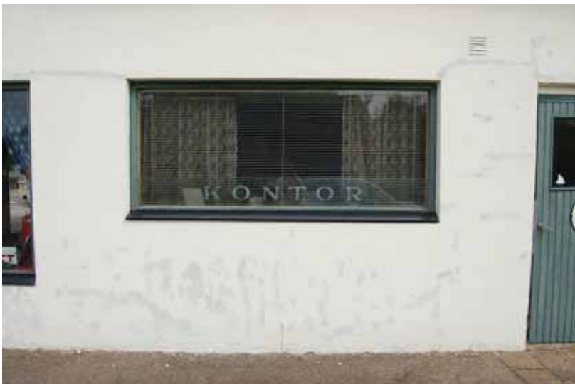
Östra fasaden med bevarad originalruta. Här låg och ligger kontoret. Här fanns också taxiverksamheten.