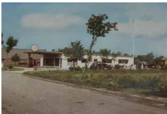
Bensinstationen 1948 med den norr om liggande ekonomibyggnaden. Stationsföreståndarens villa i söder är ännu inte byggd.

Direkt norr om bensinstationen låg en ekonomibyggnad tillhörande en gård. Ekonomibyggnaden är nu borta. Direkt söder om stationen var det öppen mark. Här uppfördes någon gång mellan 1948 och 1969 bensinstationsföreståndarens ett bostadshus.