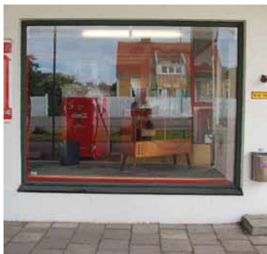
Bilden till vänster: Dörren till den norra entrén. Bilden till höger: Ett av butiksönstren.