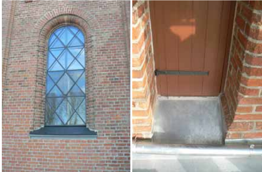
Efter renovering och målning av fönster och tornlucka