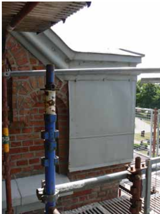
Plåtinklädnad på södra sidan mellan långhus och torn, före demontering