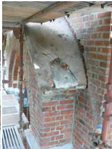
Exempel på skadade cementtillverkade byggnadsdelar