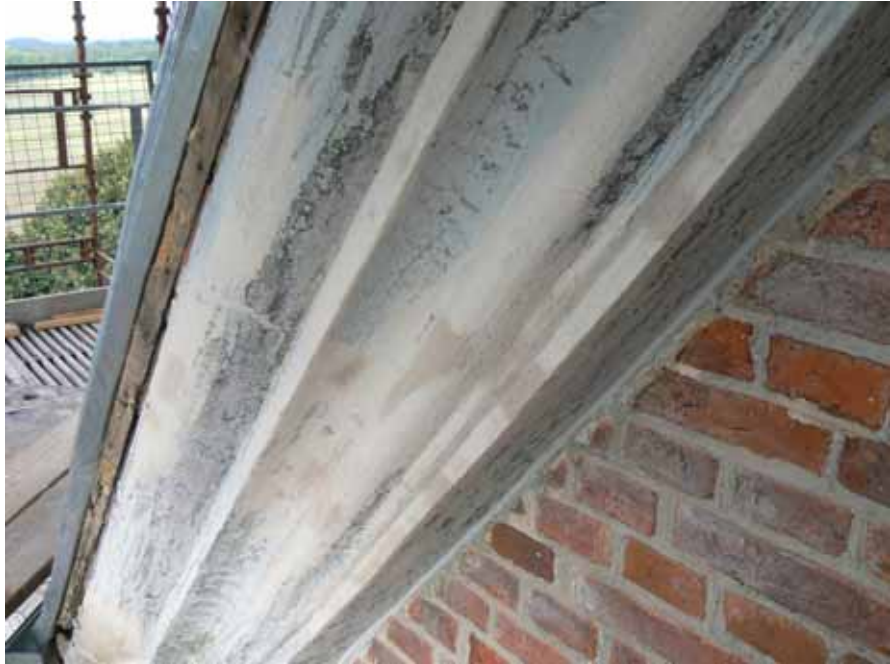
Påträffade äldre färgfragment