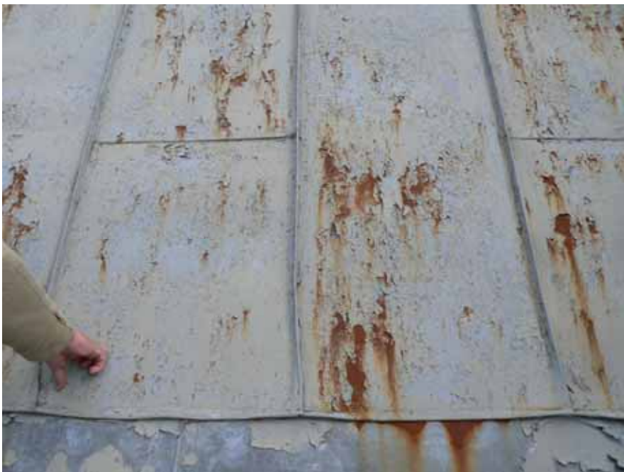
Rostskadade gråmålade stålplåtar