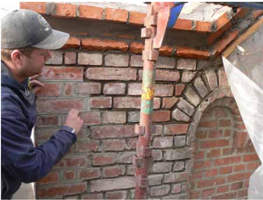
Omfogning på östra gavelkrönet