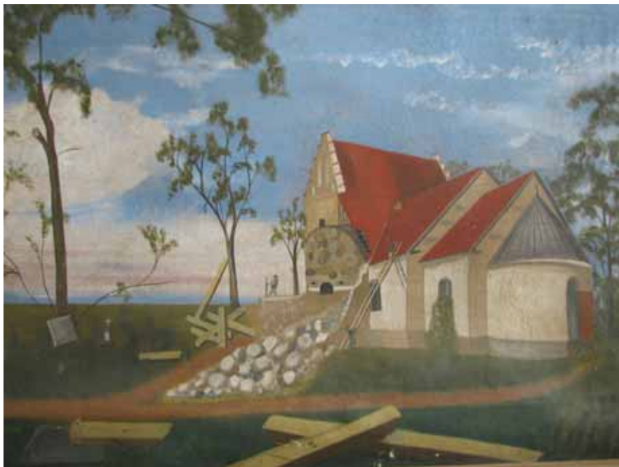
Rivning av Tranås medeltida kyrka. Äldre oljemålning, tillhör Brösarp-Tranås församling