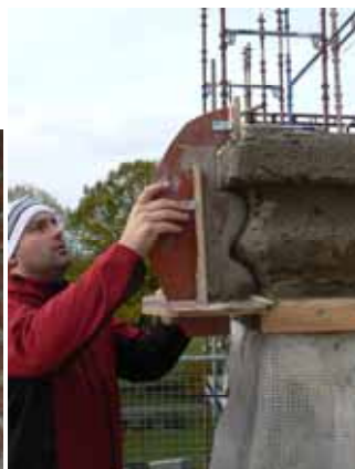
Arbete med nya listdragningar som ersatte skadade utsmyckningar