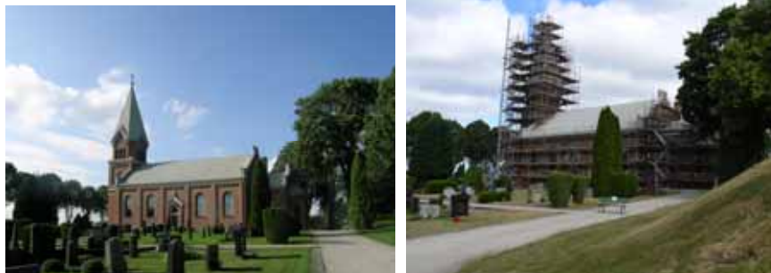
Tranås kyrka 2005, Byggnadsställningar på plats 2008-06-24

2002 I samband med en invändig restaurering under ledning av Arkitekt- och Restaureringskonsult AB, fick sakristian ny ytterdörr och sydportalens utvändiga handikappramp förlängdes och belades med cementplattor.