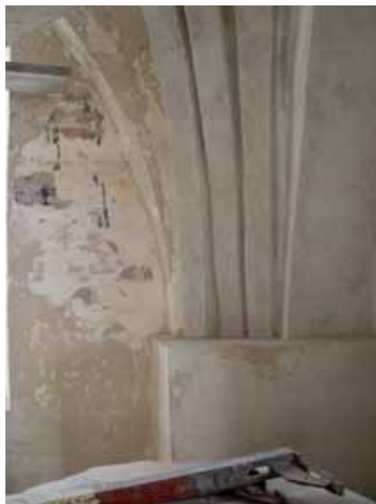
Draperimålning på nordväggen.

Dekorationen kan inte genom utförande eller stil, ej heller stratigrafiskt omedelbart relateras till någon av kordekorationerna. Utförandet förefaller grovt vid jämförelse med korets draperi med tofsar.