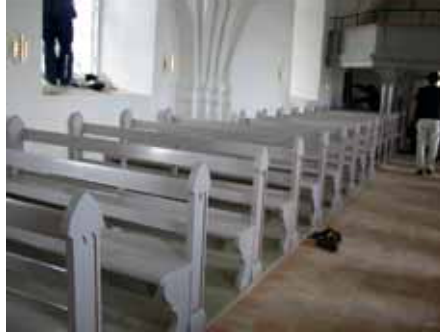
Bänkar, golv och väggarmatur efter.

På orgelläktarens barriär monterades ett lågt smidesräcke tillverkat av smitt rundstål som målades med grafitpigmenterad linoljefärg.