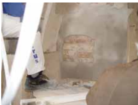
Norra nischen före.