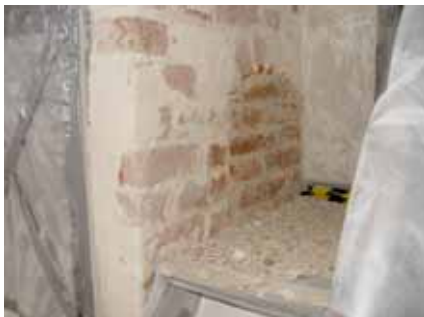
Södra nischen före.

Förutom nämnda puts- och färgskikt framkom det vid nedtagningen av skadad puts även två igensatta mindre nischer, placerade på ömse sidor om triumfbågsöppningen som skiljer långhuset från koret. Den södra delvis bakom predikstolen och den norra vid dopfunten. Nischernas placering tyder på att det rör sig om sidoaltarnischer.