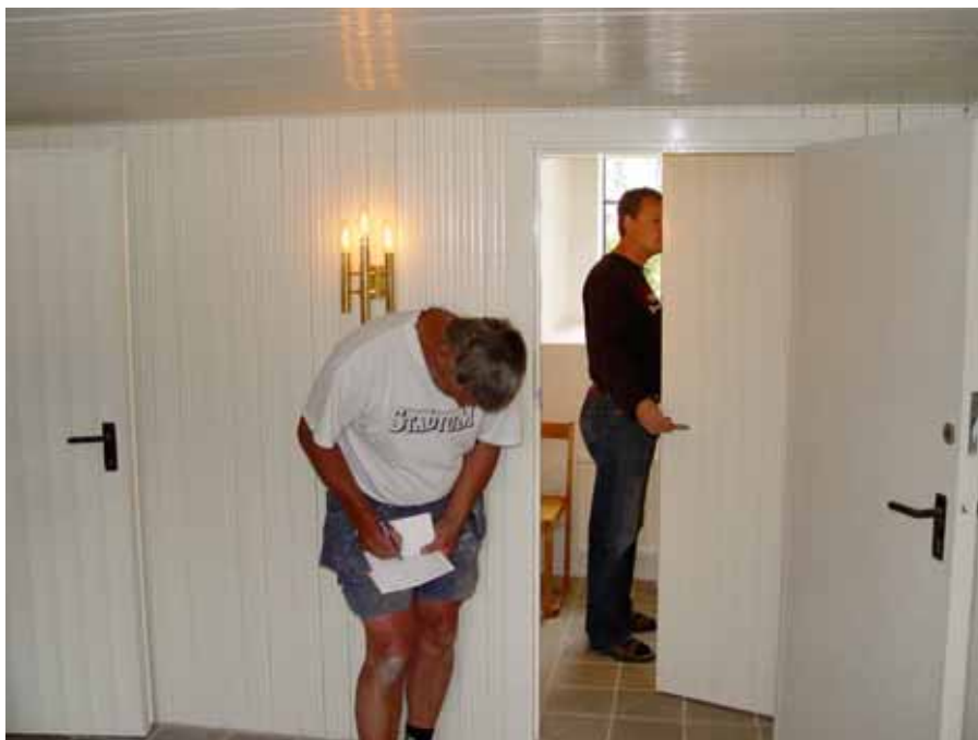
Ny golvbeläggning i sakristian.

Vaktmästarens manöverpanel flyttades till ny plats på södra sidan om mittgången.