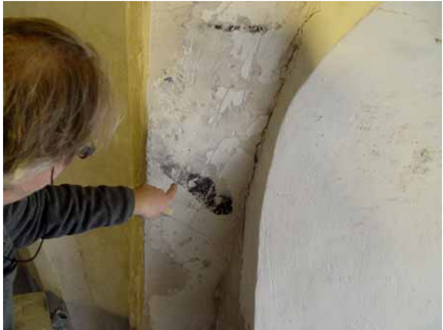
Färgfragment på sköldbågen på nordväggen.

Draperimålning i svart, rött, grått och en tunn gul kontur (lokalt) samt rent vitt som tunn linje på röd yta. Med vertikalt i svart tecknade gardiner på grå botten på ömse sidor av nischen. Draperiets horisontella överdel i grått och rött finns på den övre delen av den anslutande sköldbågen.