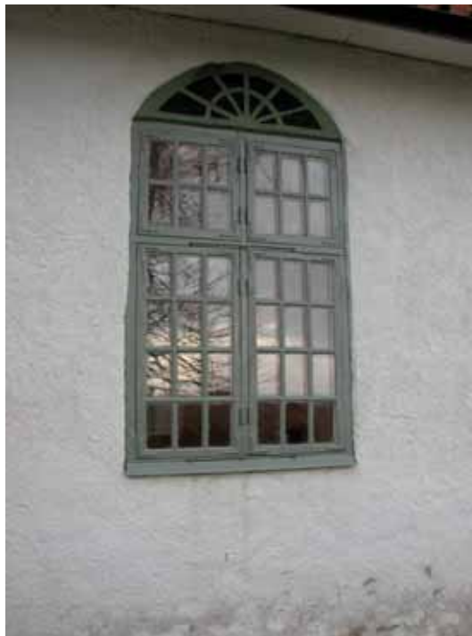
Fönster på sydfasaden.