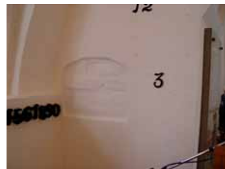
Norra nischen efter.