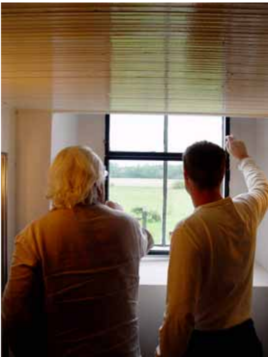
Gjutjärnsfönster i vapenhuset med innanfönster.

Insidorna på gjutjärnsfönstren i vapenhus och sakristia rengjordes, omkittades med nytt linoljekitt och målades därefter med grafitpigmenterad linoljefärg. Innanför dessa monterades nytillverkade innerfönster av vinkeljärn. All målning med linoljefärg är utförd med fabrikat Gunnar Ottosson Färgmakeri, medan målning med alkydoljefärg för trägolv och trappan i vapenhuset var av fabrikat Beckers.