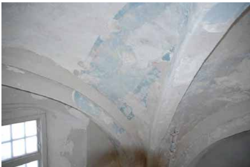
Draperimålning i blått.

Över den blåa dekorationen ligger två definierbara kalkskikt, först ett ljust gul-tonat och sen ett grått. Korets norra fönsternisch undersöktes i relation till målningens fragmenten. Putsen i nischen har bara ett mycket välbundet kalkskikt – samma skikt som utgör det första överkalkningsskiktet på den blåa ytan.