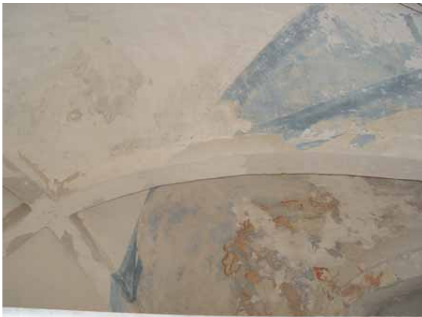
Draperimålning i blått med underliggande äldre dekorationsmåleri.

kapporna, anslutande valvribbor och sköldbågar. Den i valvkapporna med anslutande valvribbor och sköldbågar himmelsblå färg får närmast betecknas som resterna av en målad baldakin. Med tanke på att blå färgämnen genom tiderna varit svåra, och framförallt dyra, att få fram var det först under 1800 talets första hälft som tillgången till syntetiska blåa färger gjorde det möjligt att i någon större utsträckning använda dessa pigment. Det är möjligt att den blå målningen tillkom så sent som i samband med Helgo Zettervalls stora restaurering 1876-77 men troligare kan arbetet sättas i samband med empireperioden.