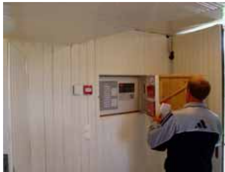
Igensatt ingång till elrum med nytt larmskåp.

Tegelklinker (gråa) ersatte kraftigt förmultnat trägolv i sakristia.