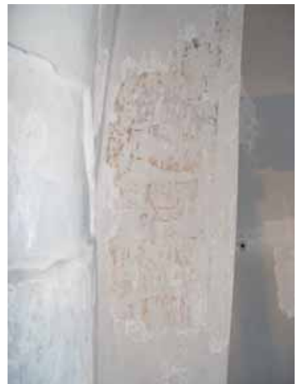
Rest av yngre schablonbård troligen sent 1800-tal eller tidigt 1900-tal.