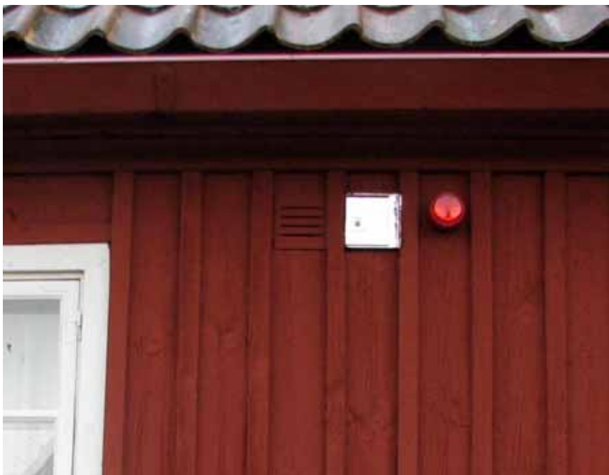
Nyckelskåp på kyrkhuset.

Krav från brandskyddsmyndigheten att nyckelskåpet skall vara väl synligt löstes med att skåpet monterades på den intilliggande kyrkhusets södra vägg istället för på kyrkobyggnaden.