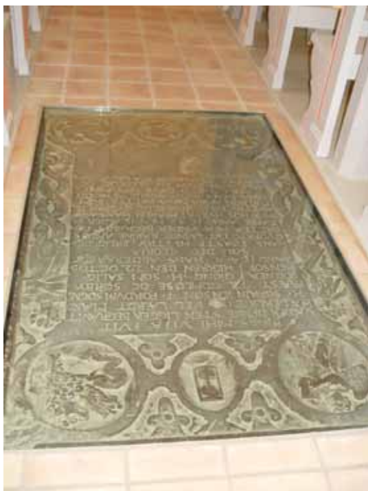
Gravsten med glasskiva.

Befintlig stolpbelysning på kyrkogården ersattes med ny stolparmatur från Västergårds Classic AB. Även belysningen vid kyrkhuset och parkeringsplatsen kompletterades med stolparmatur av samma typ.