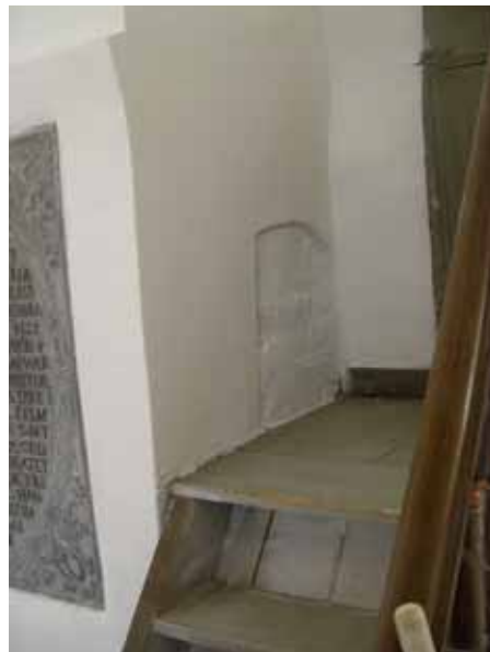
Södra nischen efter.