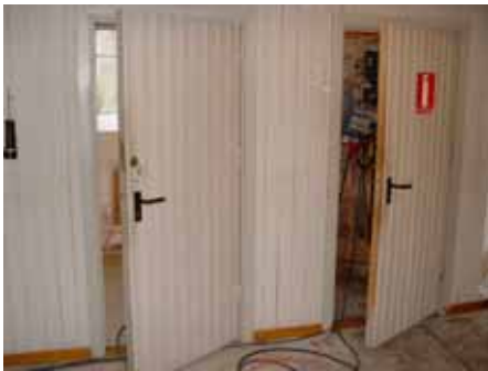
Ingångar till sakristia och elrum före.

Ändring elrum. Väggen mellan befintlig elcentral och sakristia ersattes med murad vägg och pardörr enligt ritningar upprättade av K-el 2006-04-06. Den tidigare dörren till el-centralen sattes igen. Befintlig väggpanel återanvändes för igensättning av den tidigare dörröppningen till elcentralen.