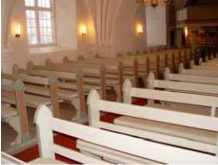
Bänkar, golv och väggarmatur före.