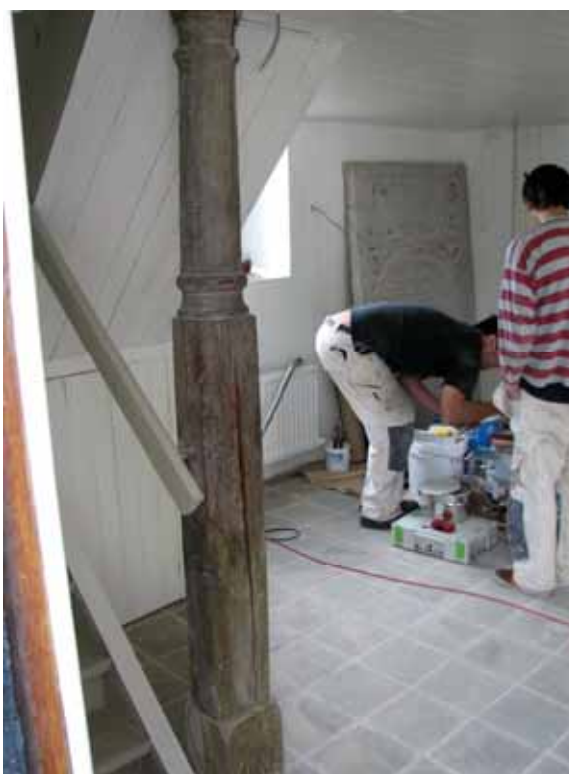
Nytt golv i vapenhuset.

Åtgärderna omfattar delvis omputsning och lagning av väggar och tak. Puts-lagningen innefattade ca 98 kvm (i handlingarna beräknades ca 50 kvm). Ommålning av puts och snickerier, renovering av golv under bänkar. Nytt tegelgolv i långhuset, sakristia och vapenhus. Renovering av altarring, byte och komplettering av elektrisk belysningsinstallation (17 nya lampetter: 12 till kyrkorummet, 3 till vapenhuset och 2 till orgelläktaren). Förutom kompletteringen av armatur utförde Fongs Gelbgjuteri polering och omläggning av el i befintliga två ljuskronor från 1973.