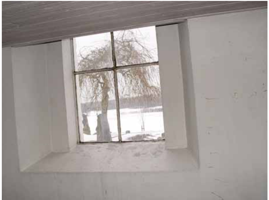
Gjutjärnsfönster i vapenhuset före insättning av innanfönster.

In- och utvändig målning av träfönster. På grund av att vissa delar av ytterfönstren var murkna ersattes dessa delar med nytt trä.