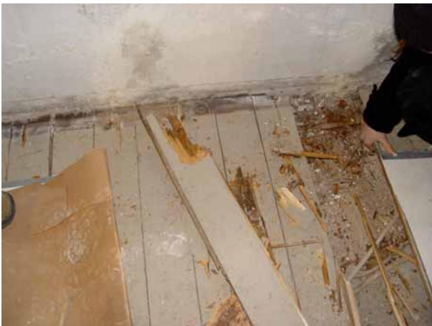
Rötskadat golv i sakristian.

Tegelklinker (gråa) ersatte kraftigt förmultnat trägolv i sakristia.