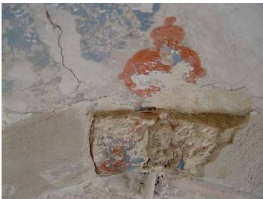
Dekorationsmåleri ”snidat krön” i koret.

Ljust gul-tonat (även partier av grå-tonat) på grund av fukt-skador – mögel eller ut-fällningar. Skiktet har mycket god bindning till puts-underlaget och kan därför för-modas vara samtida med puts-skiktet. På detta skikt ligger en dekorations-målning i den nedre delen av den östligaste valvkappan. Målningen går även ner på anslutan-de gördelbåge. Dekorationen i röd järnoxid, kulör engelskt röd, har formen likt ett ”snidat krön” till en uppställning av en altar-upsats eller epitafium i renässans- eller möjligen barockstil. Krönet har tre dekorationer, likt svarvade klot med spetsar, i mitten och på ytterflankerna. Färgskiktet är svårlöst i vatten. Någon övrig mål-