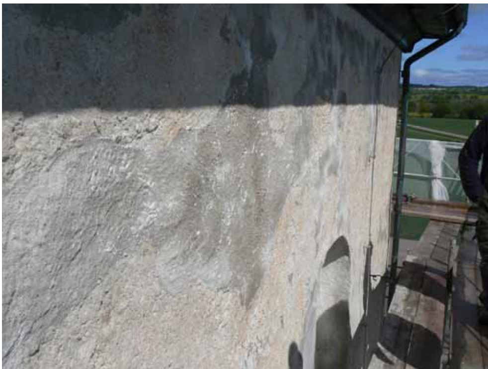
Efter rengöring framkom olika brukssammansättningar i tidigare lagningar