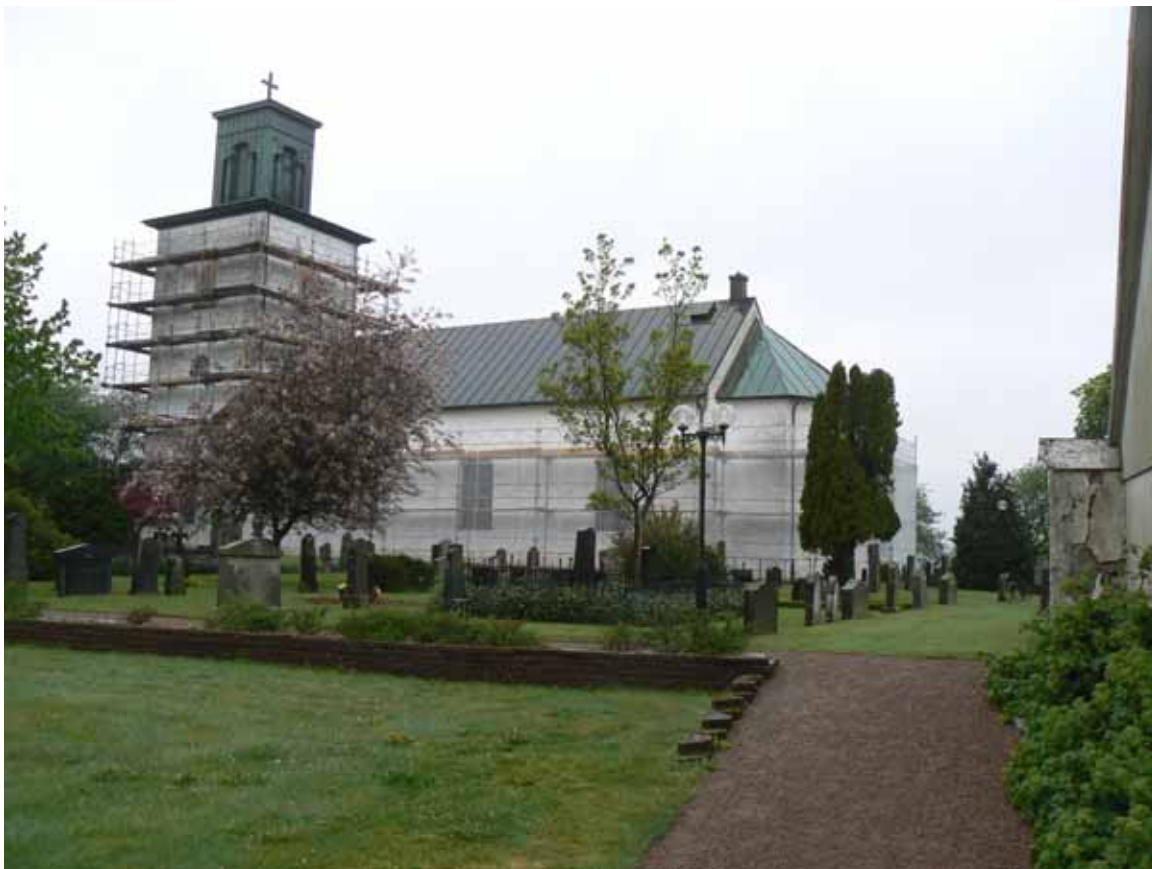
Påbörjad rengöring av fasaderna i maj 2009