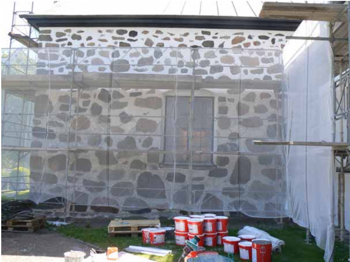
Norra korsarmens västfasad