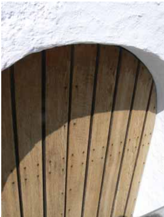
Tornlucka före behandling med träolja