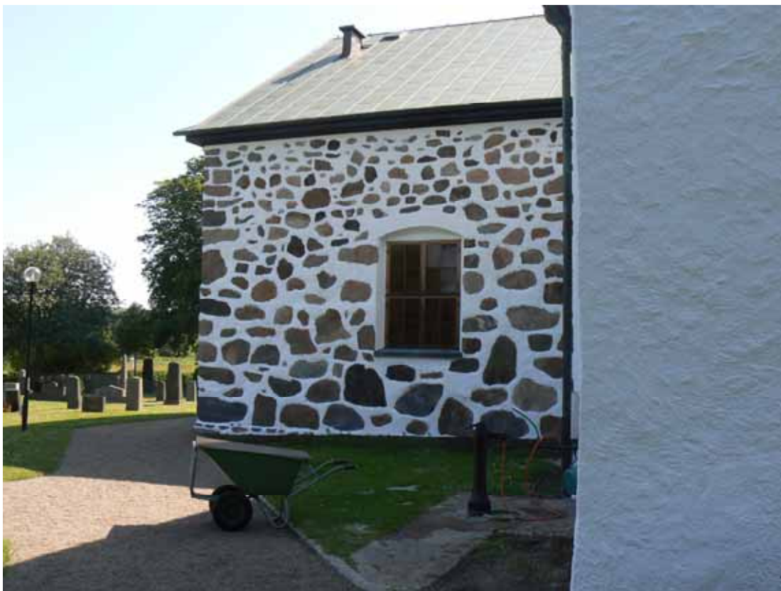
Nyfogad och avfärgad