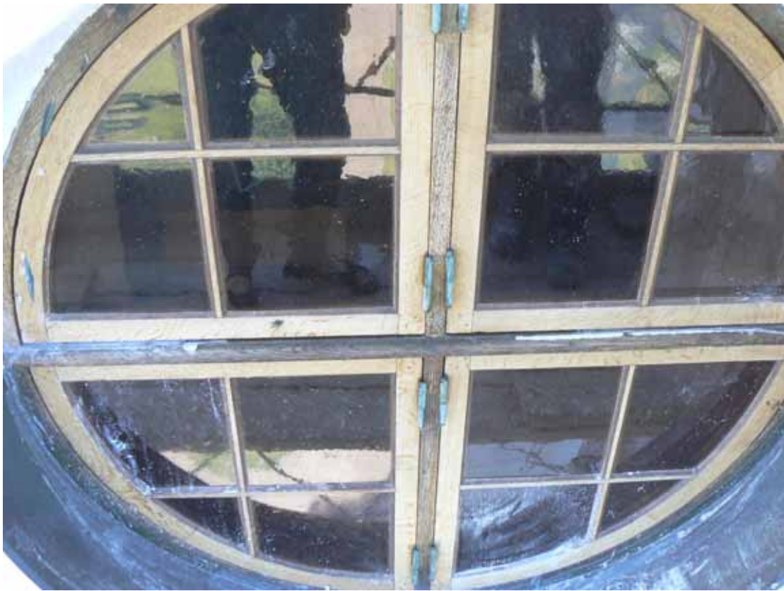
Övre tornfönster efter rengöring