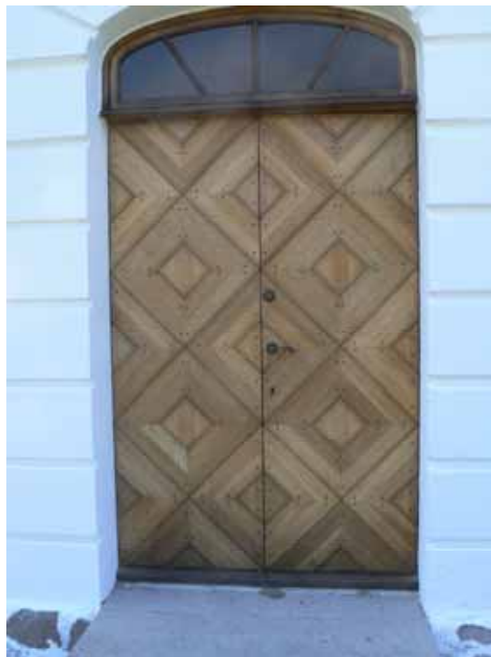
Västporten efter träolja-behandling