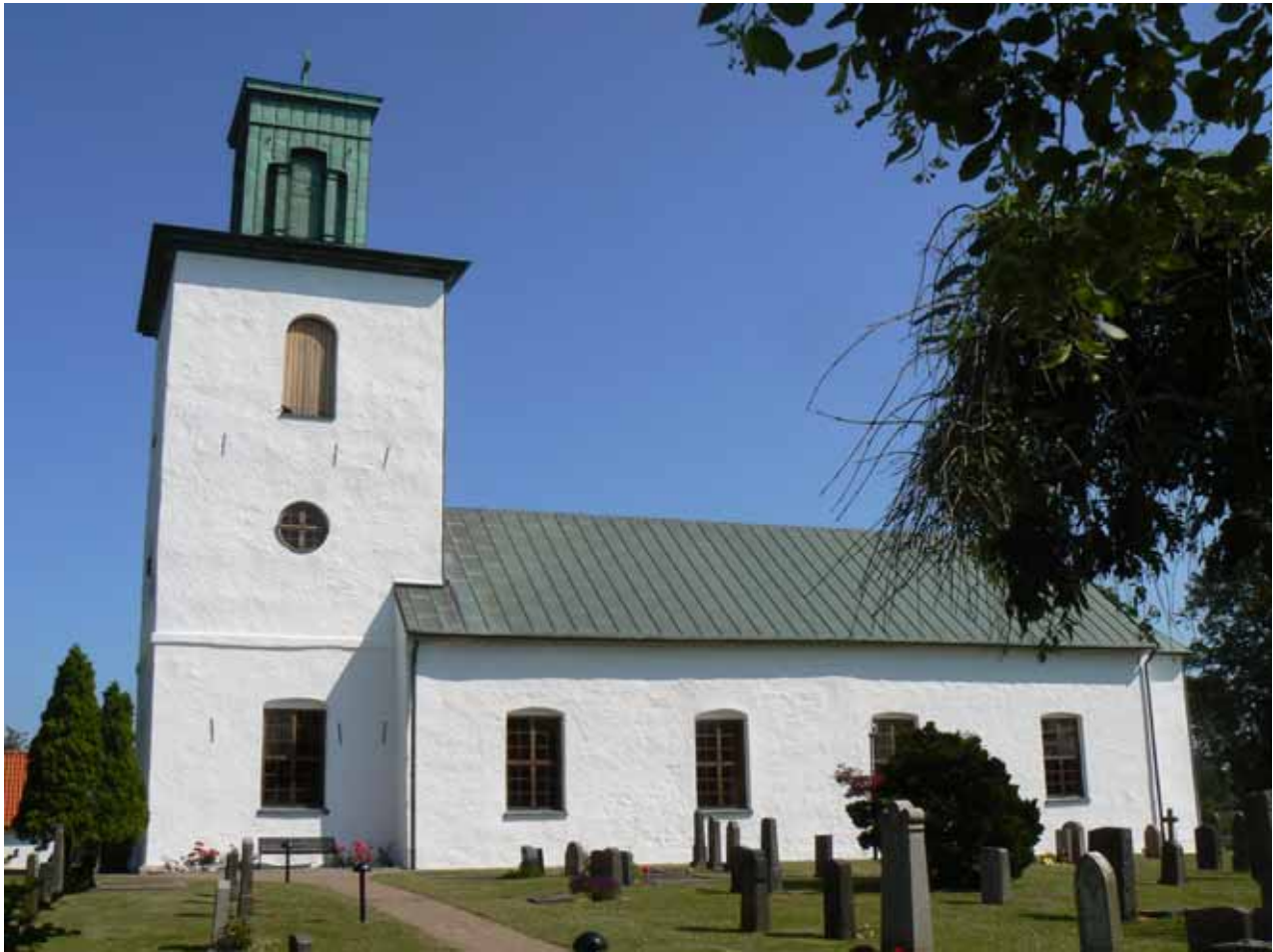
Kyrkans södra fasad 2009-07-02