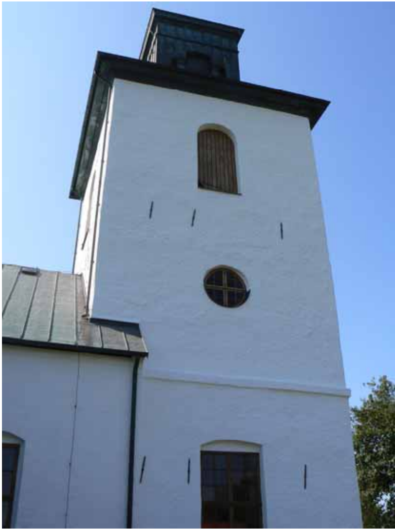
Tornets norra fasad avfärgad och med nytt stuprör på tornets övre del